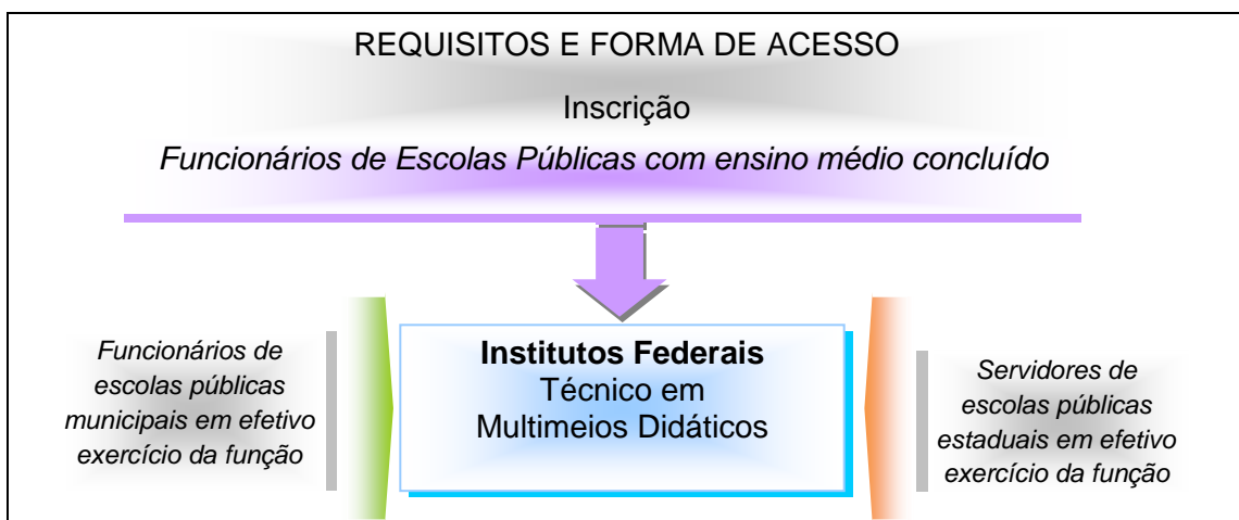
Figura 1 – Requisitos e formas de acesso ao curso.

Estar em efetivo exercício da função nas escolas das redes estadual ou municipal.