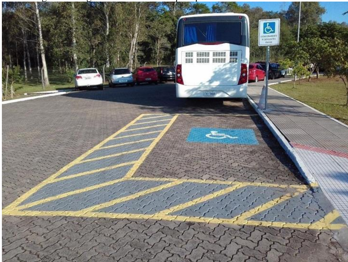
Figura 1– Vaga de estacionamento para pessoas com deficiência física.

Necessidades Especiais (NAPNE) com equipamentos dotados de tecnologias assistivas. Algumas destas estruturas estão visíveis nas imagens registradas da infraestrutura de acessibilidade do câmpus Venâncio Aires.