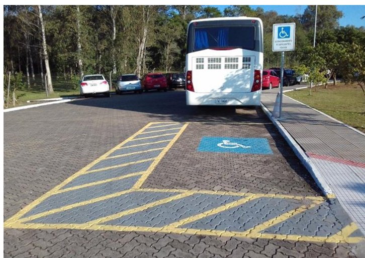
Figura 1– Vaga de estacionamento para portador de deficiência física.

Para o planejamento das estratégias educacionais voltadas ao atendimento dos estudantes com deficiência, será observado o que consta na Instrução Normativa nº 3 de 2016, que dispõe sobre os procedimentos relativos ao planejamento de estratégias educacionais a serem dispensadas aos estudantes com deficiência, tendo em vista os princípios estabelecidos na Política de Inclusão e Acessibilidade do IFSul.