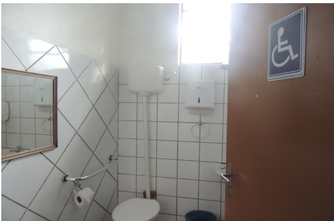
Banheiro PNE ( Bloco 1).