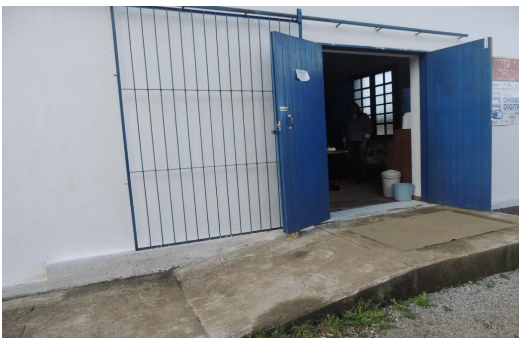
Acesso Multiuso (Bloco 2).