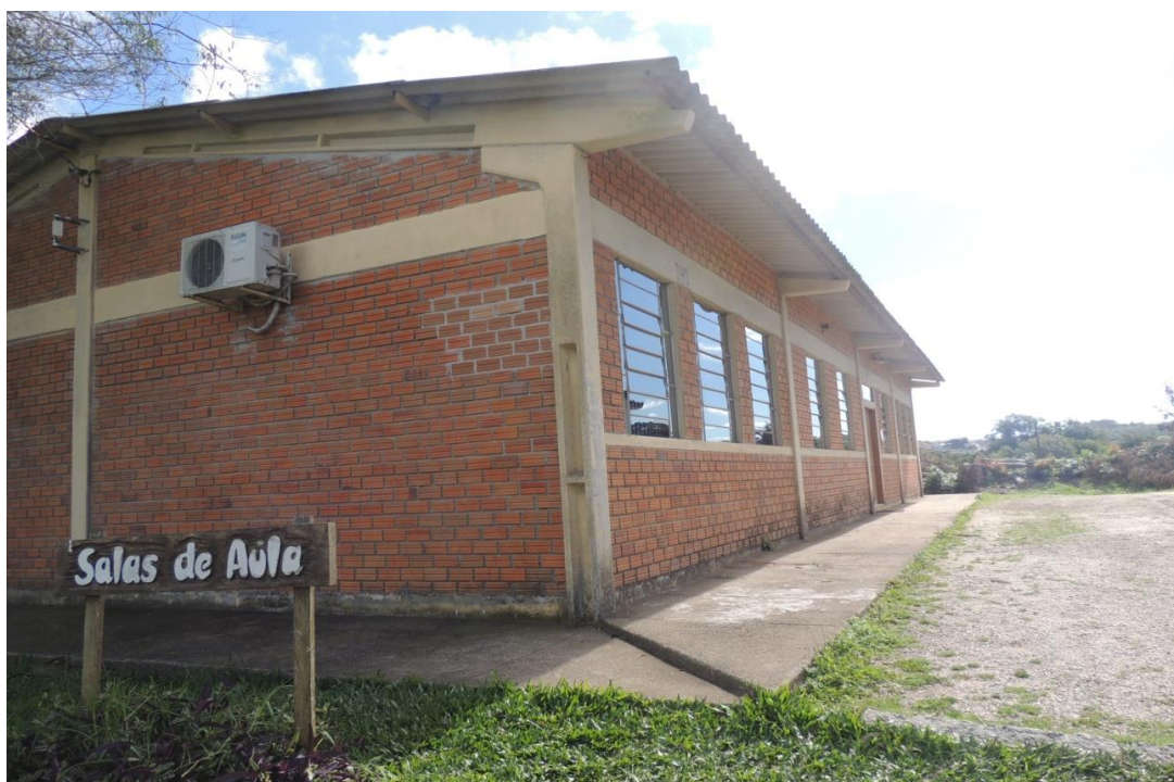
Vista externa Bloco 1.