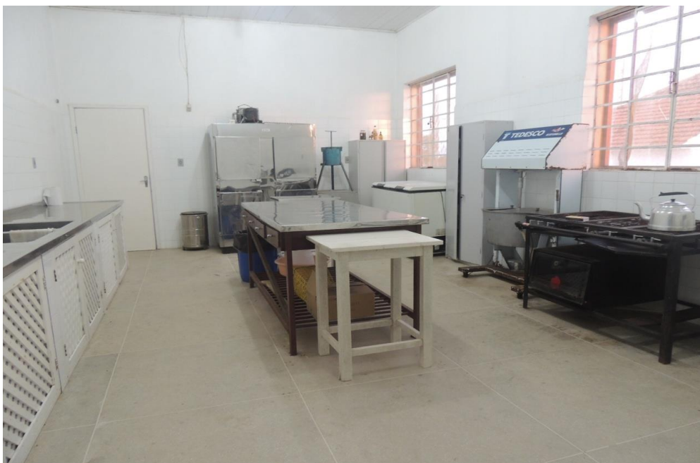
Cozinha ( Bloco 3).