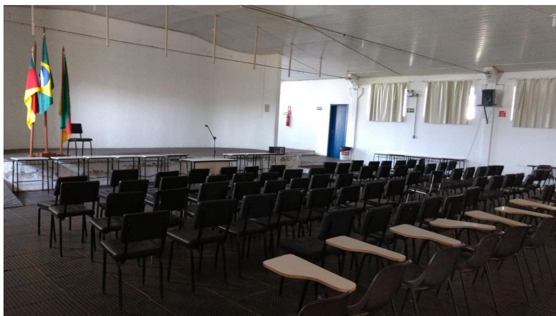
Vista interna do Auditório.