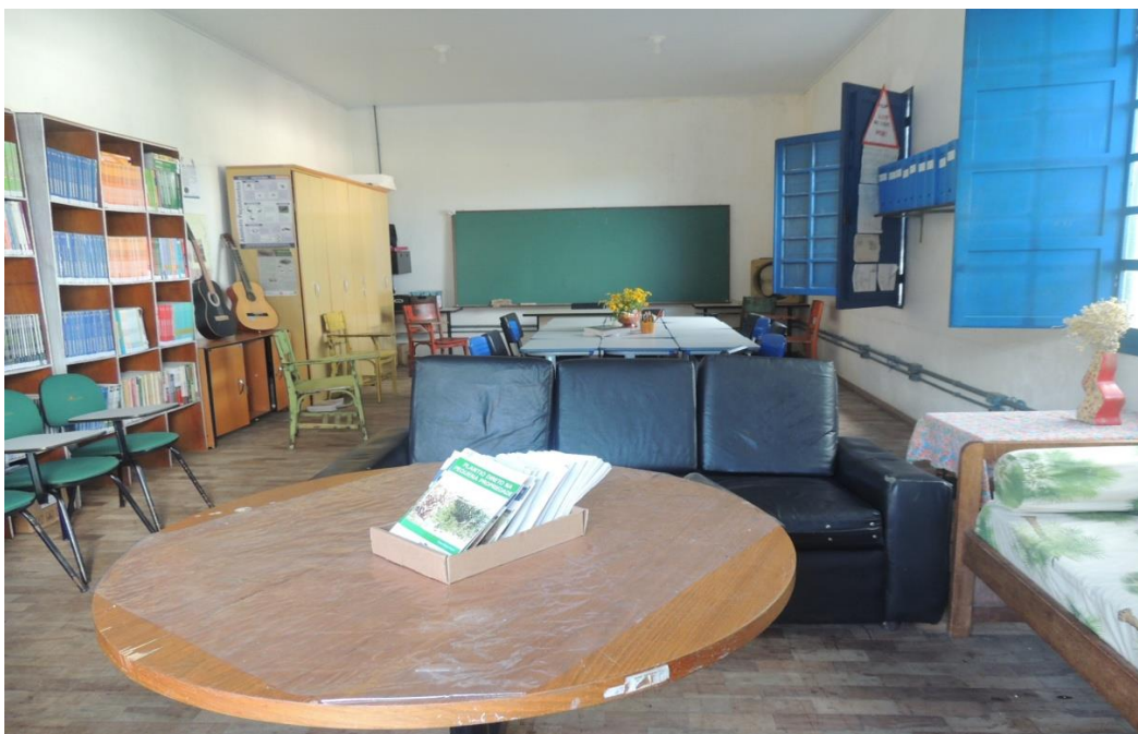
Sala Multiuso (Bloco 2).