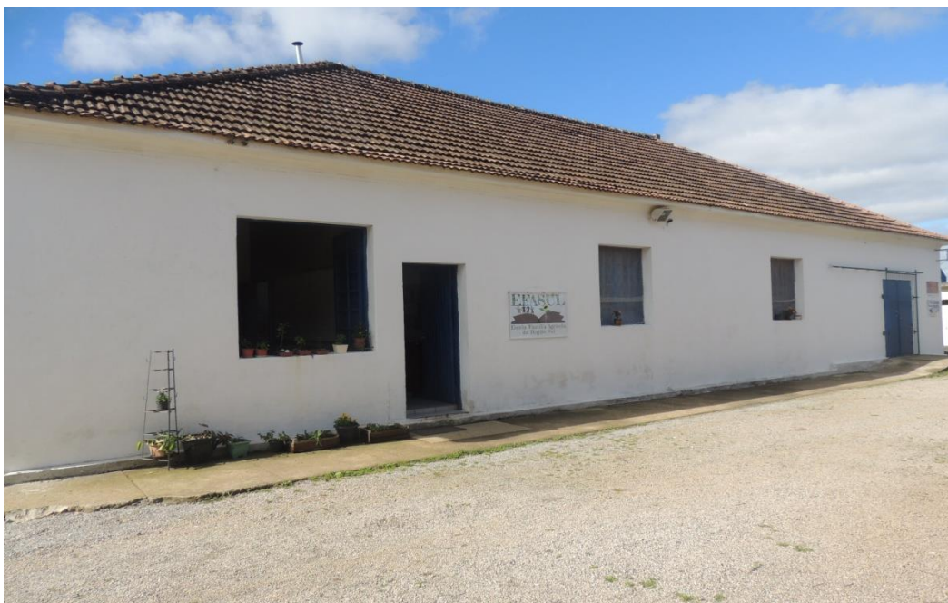
Vista externa (EFASul – Bloco 2).