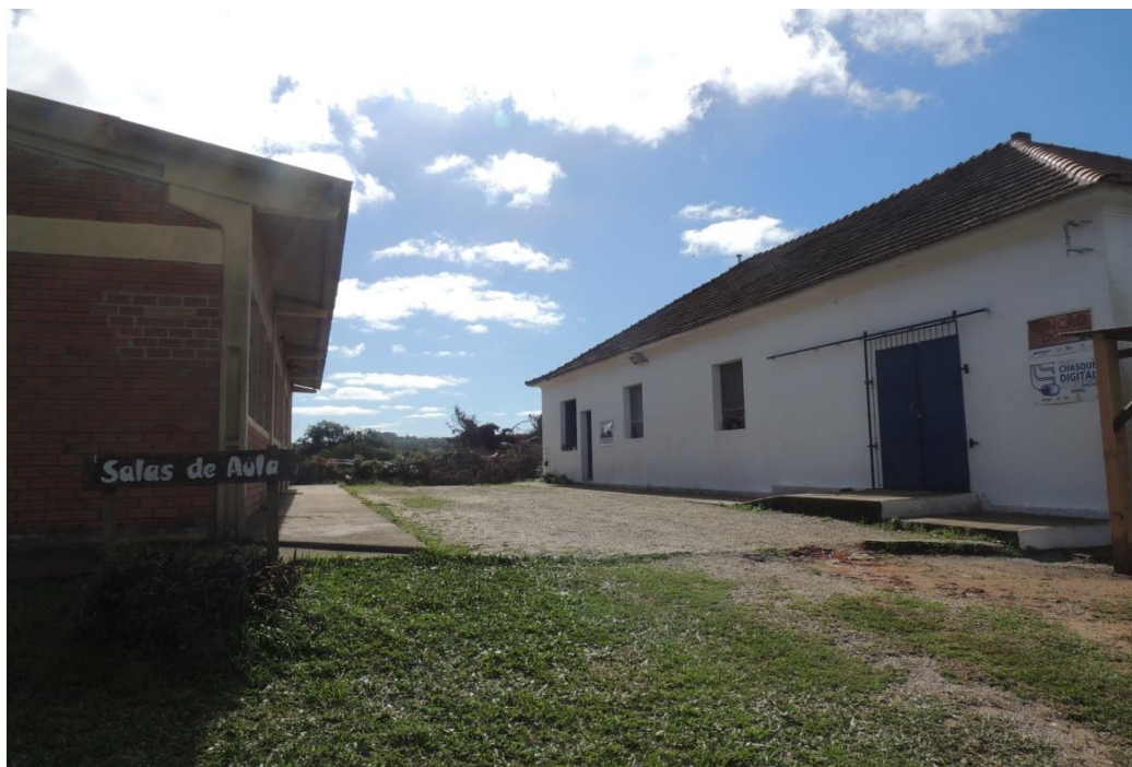
Vista externa Bloco 1 e 2.