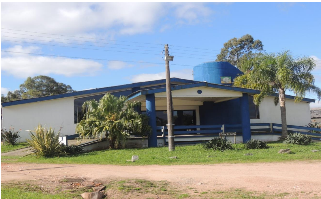
Vista externa Auditório .