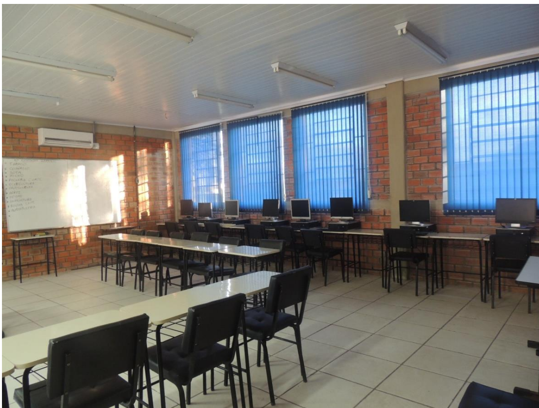
Sala de aula ( Bloco1).