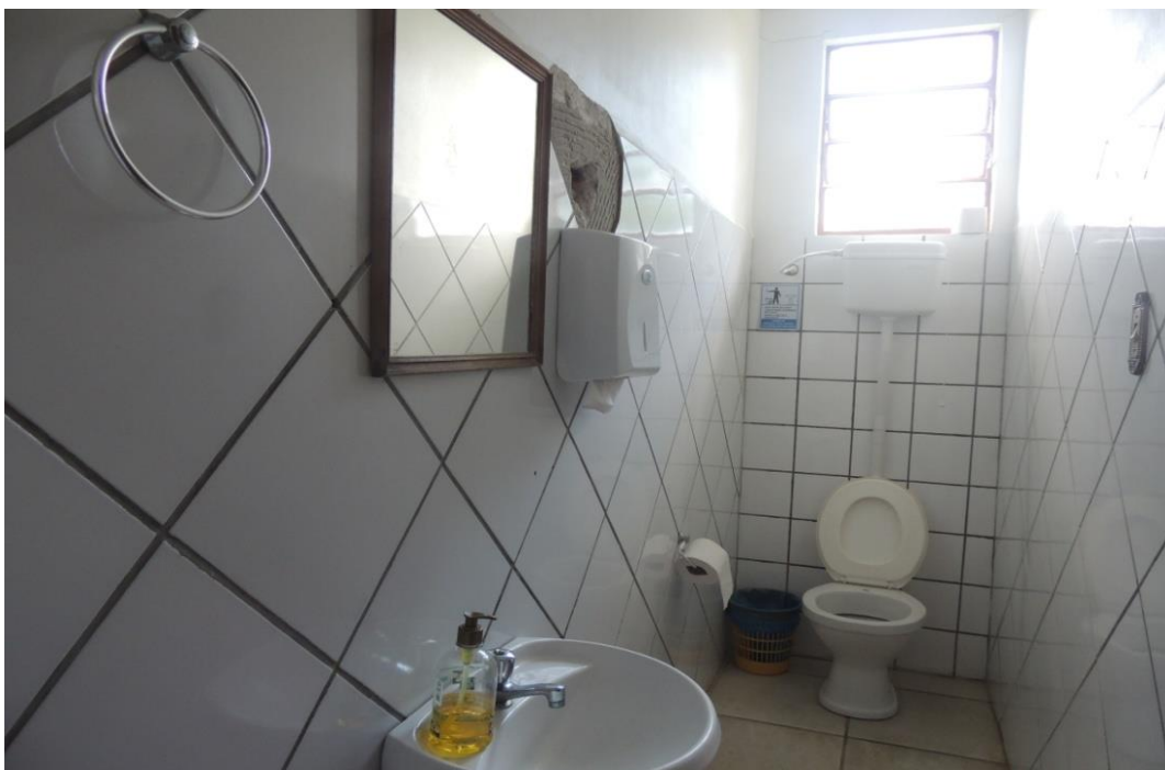
Banheiro Professores ( Bloco 1).