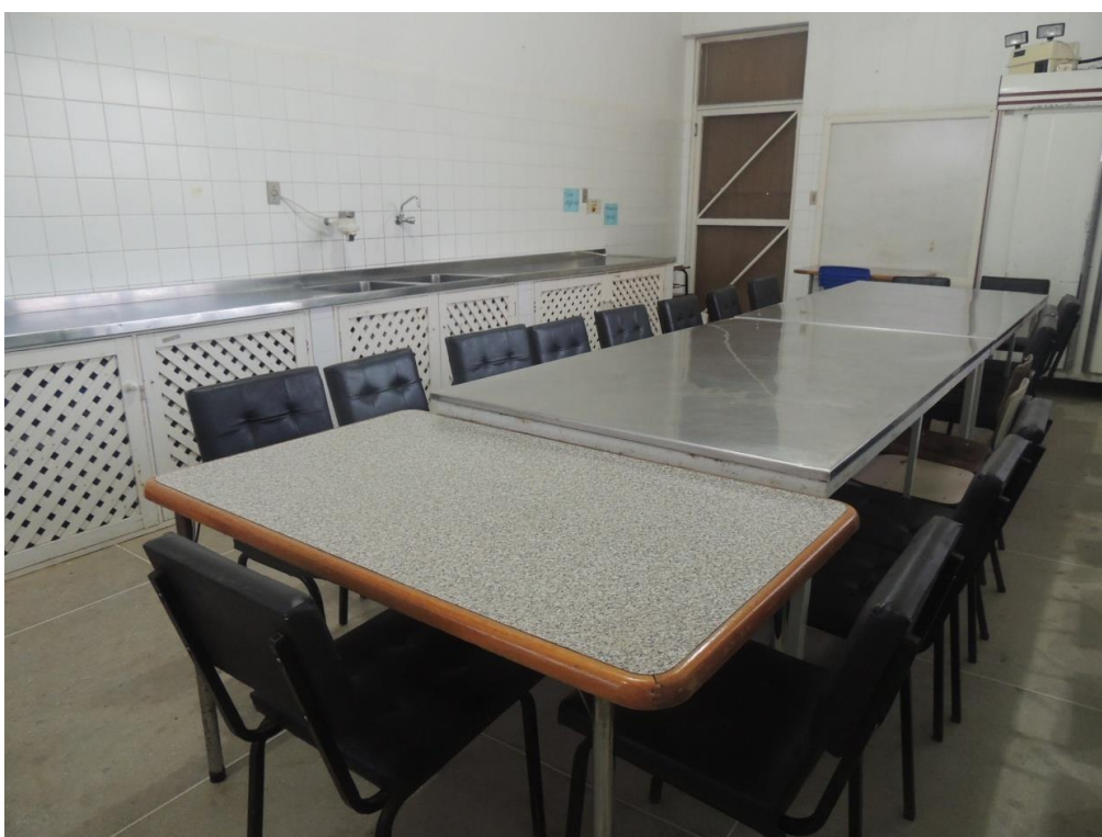
Refeitório ( Bloco 3).