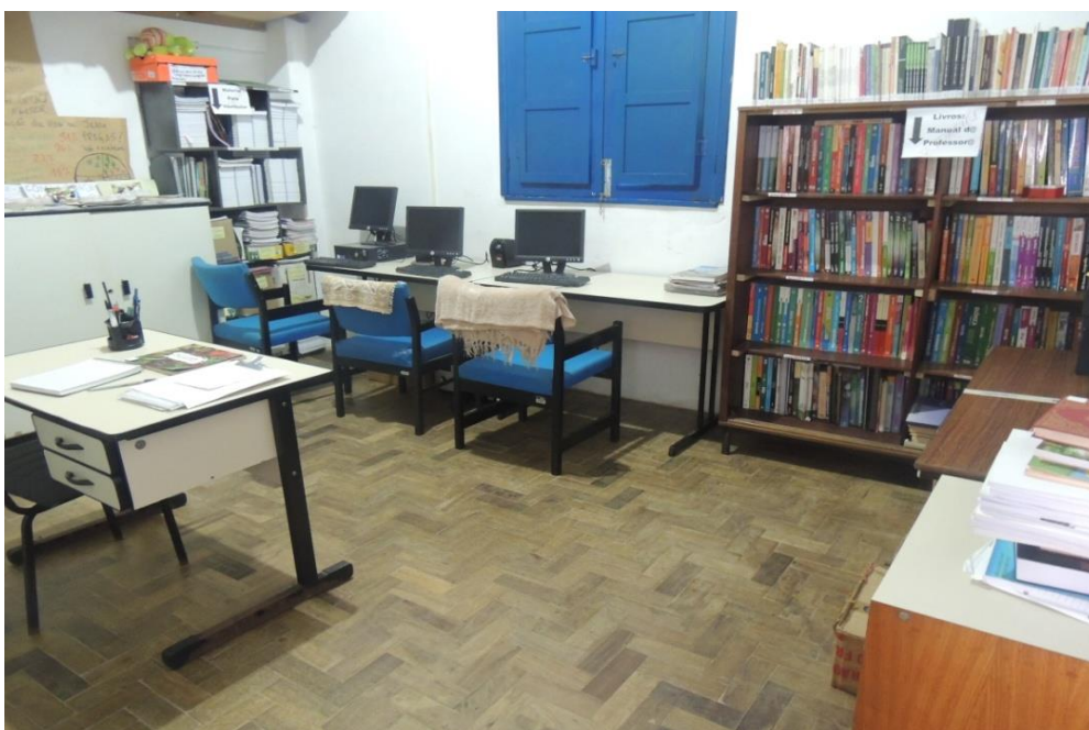
Direção / Coordenação pedagógica ( Bloco 2).