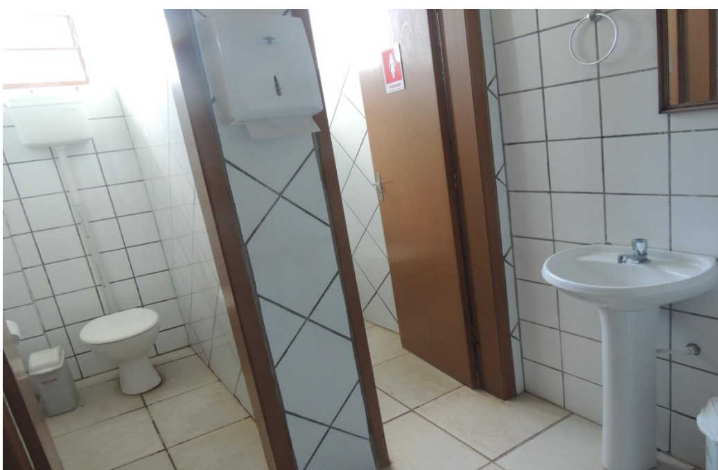
Banheiro feminino ( Bloco 1).