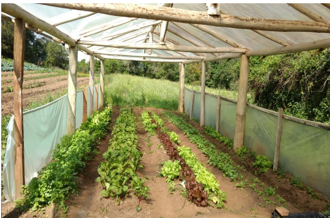
Espaço interno da estufa didática.