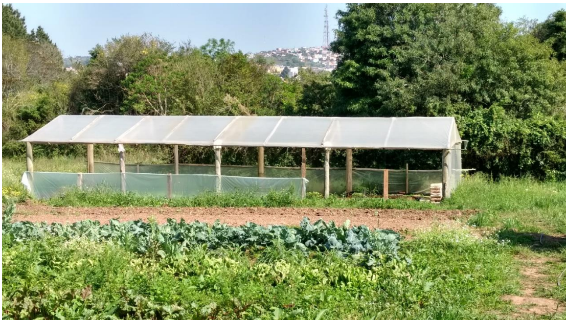
Vista externa da estufa didática e horta.