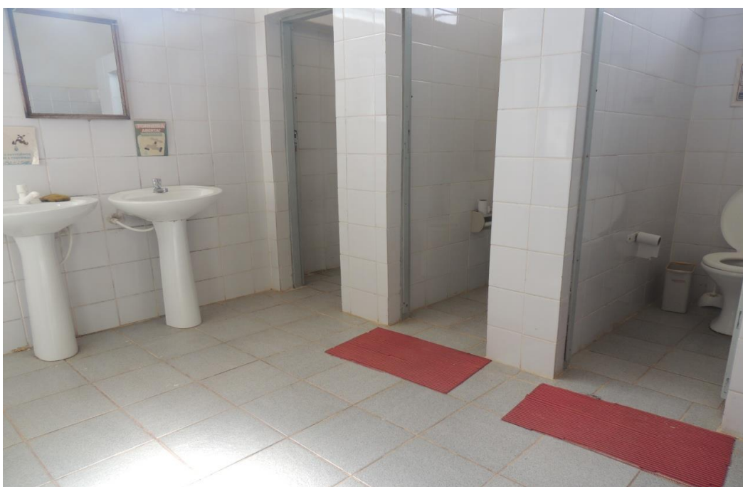
Banheiro masculino (Bloco 2).