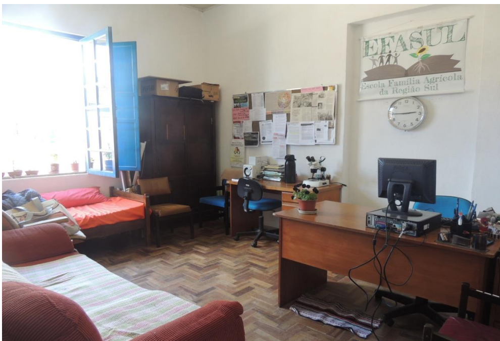
Secretaria ( Bloco 2).