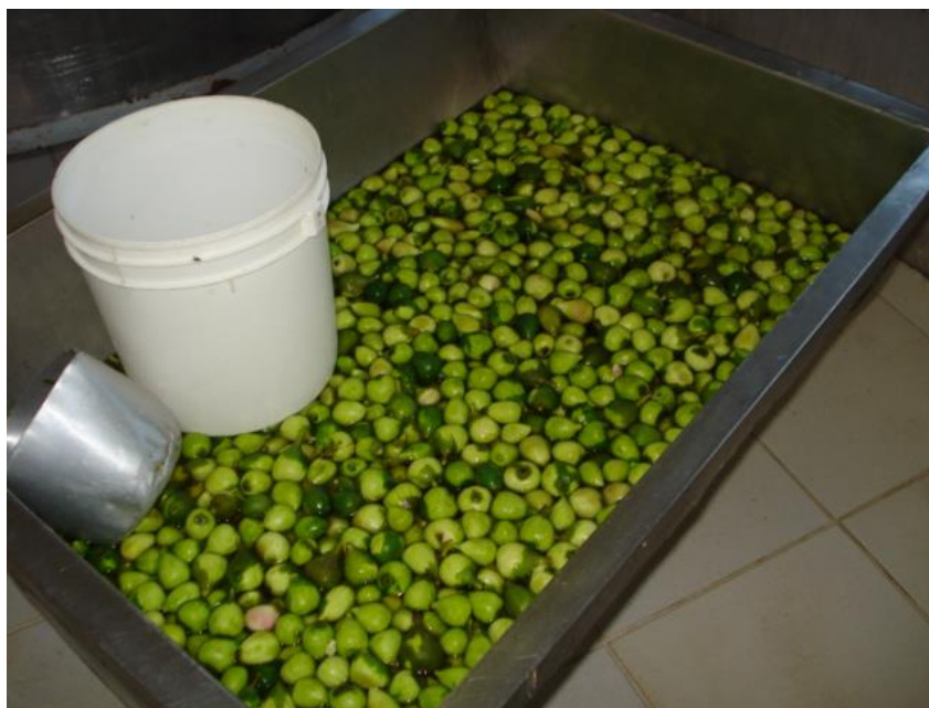
Figura 1 - Lavagem de figos em imersão de água.

Representa a revisão de literatura sobre o tema do estágio obrigatório. Pode subdividir-se, de forma detalhada, em capítulos ou seções. Neste espaço, é possível colocar figuras, as quais devem ser identificadas da seguinte forma: