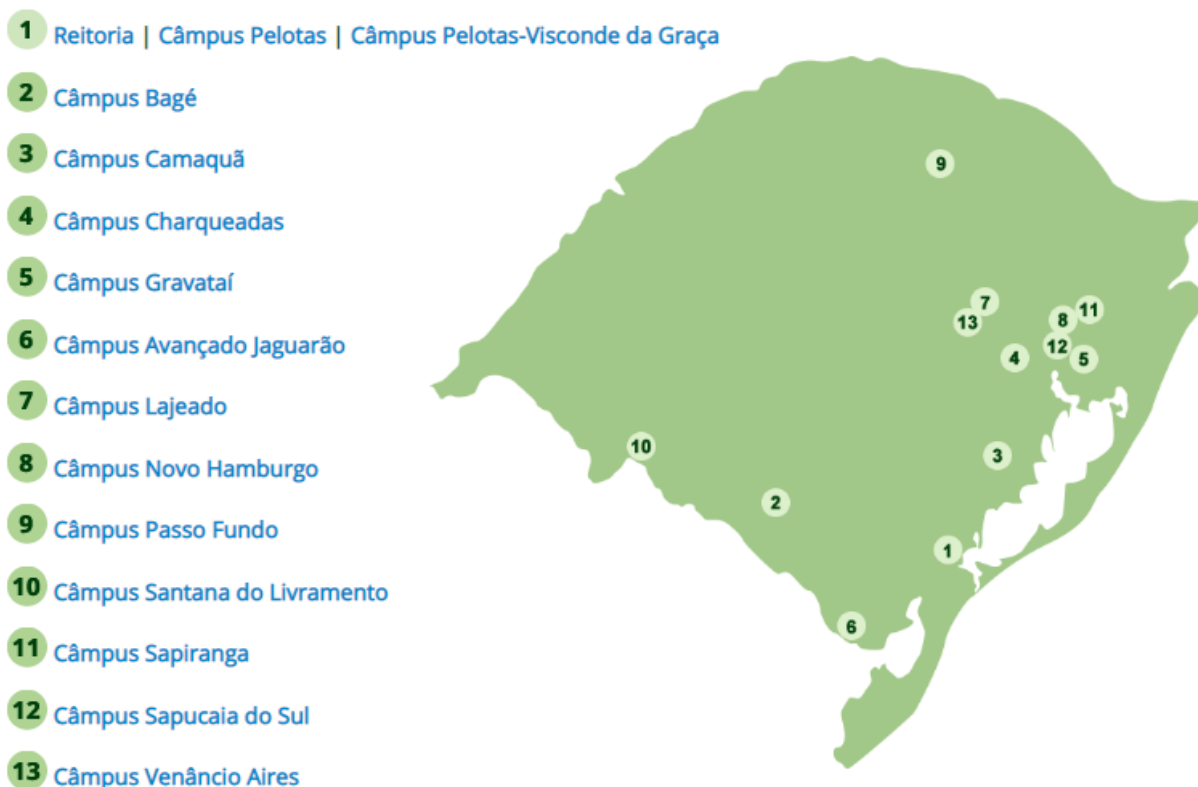
Figura 1 - Distribuição das unidades pelo Estado

Segundo a Plataforma Nilo Peçanha (PNP), que reúne dados da Rede Federal de Educação Profissional, Científica e Tecnológica (Rede Federal) para fins de cálculos de indicadores, o IFSul atende um total de 169.085 discentes (ano base 2021), matriculados nos diversos cursos oferecidos, incluindo os de formação continuada a distância. Também exerce o papel de instituição acreditadora e certificadora de competências profissionais.