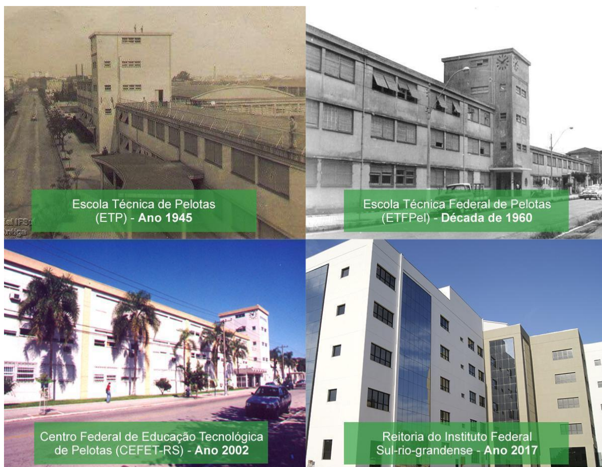
Figura 3 – Fotos dos Prédios da Instituição ao longo do tempo

O Instituto Profissional Técnico funcionou por uma década, sendo extinto em 25 de maio de 1940, e seu prédio demolido para a construção da Escola Técnica de Pelotas. Em 1942, por meio do Decreto-lei nº 4.127, de 25 de fevereiro, subscrito pelo Presidente Getúlio Vargas e pelo Ministro da Educação Gustavo Capanema, foi criada a Escola Técnica de Pelotas (ETP), a primeira e única Instituição do gênero no estado do Rio Grande do Sul. Inaugurada em 11 de outubro de 1943, com a presença do Presidente Getúlio Vargas, começou suas atividades letivas em 1945, com cursos de curta duração (ciclos).