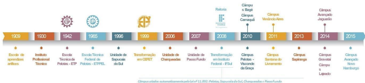
Figura 2 – Linha do tempo de evolução da Instituição.

As aulas tiveram início em 1930, quando o município assumiu a Escola de Artes e Offícios e instituiu a Escola Técnico Profissional que, posteriormente, passou a denominar-se Instituto Profissional Técnico e cujos cursos compreendiam grupos de ofícios divididos em seções: Madeira, Metal, Artes Construtivas e Decorativas, Trabalho de Couro e Eletro-Chimica.