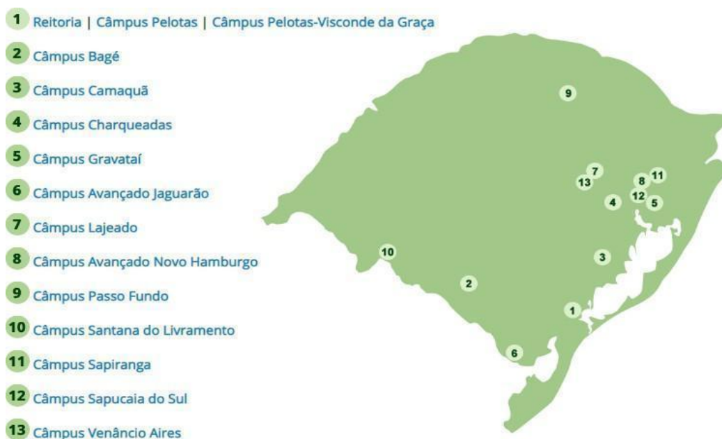
Figura 1 - Distribuição das unidades do IFSul pelo estado.

Segundo a Plataforma Nilo Peçanha (PNP), que reúne dados da Rede Federal de Educação Profissional, Científica e Tecnológica (Rede Federal) para fins de cálculos de indicadores, o IFSul atende um total de 24.369 discentes (ano base 2018), matriculados em cursos nas modalidades presencial e a distância. Também exerce o papel de instituição acreditadora e certificadora de competências profissionais.