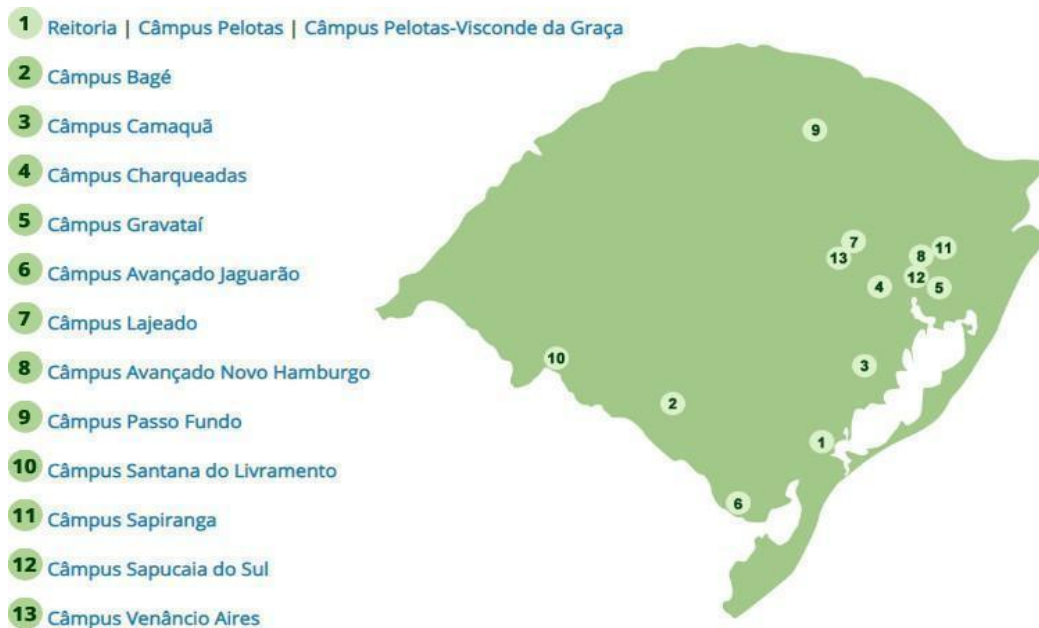
Figura 1 - Distribuição das unidades do IFSul pelo Estado

Segundo a Plataforma Nilo Peçanha (PNP), que reúne dados da Rede Federal de Educação Profissional, Científica e Tecnológica (Rede Federal) para fins de cálculos de indicadores, o IFSul atende um total de 169.085 discentes (ano base 2021), matriculados nos diversos cursos oferecidos, incluindo os de formação continuada à distância. Também exerce o papel de instituição acreditadora e certificadora de competências profissionais.