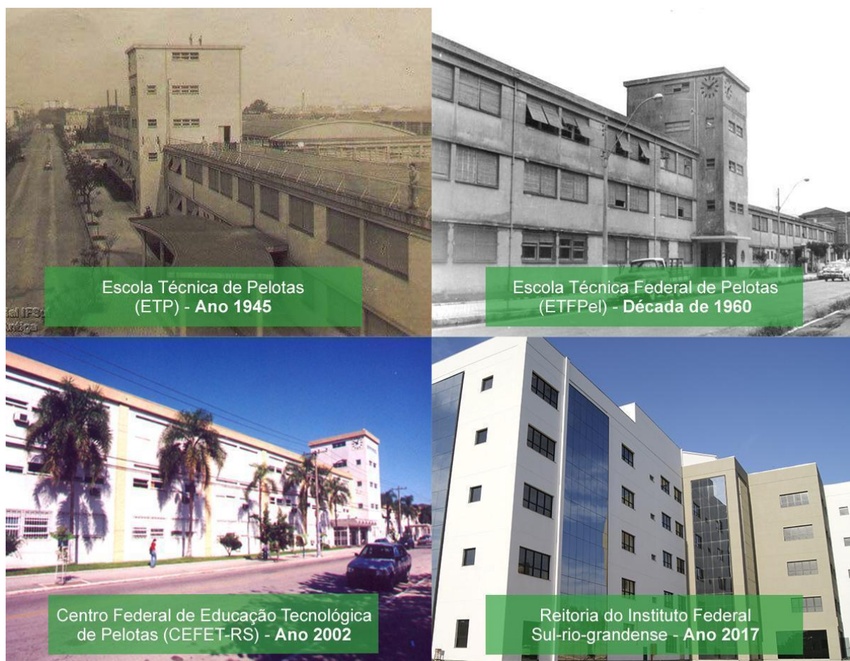
Figura 3 – Prédios da Instituição ao longo do tempo

O Instituto Profissional Técnico funcionou por uma década, sendo extinto em 25 de maio de 1940, e seu prédio demolido para a construção da Escola Técnica de Pelotas. Em 1942, por meio do Decreto-lei nº 4.127, de 25 de fevereiro, subscrito pelo Presidente Getúlio Vargas e pelo Ministro da Educação Gustavo Capanema, foi criada a Escola Técnica de Pelotas (ETP), a primeira e única Instituição do gênero no estado do Rio Grande do Sul. Inaugurada em 11 de outubro de 1943, com a presença do Presidente Getúlio Vargas, começou suas atividades letivas em 1945, com cursos de curta duração (ciclos).