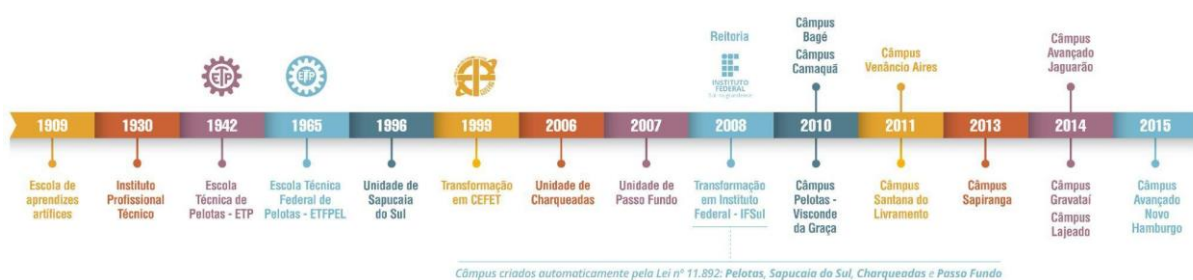
Figura 2 – Linha do tempo de evolução da Instituição

As aulas tiveram início em 1930, quando o município assumiu a Escola de Artes e Ofícios e instituiu a Escola Técnico Profissional que, posteriormente, passou a denominar-se Instituto Profissional Técnico e cujos cursos compreendiam grupos de ofícios divididos em seções: Madeira, Metal, Artes Construtivas e Decorativas, Trabalho de Couro e Eletro-Chímica.