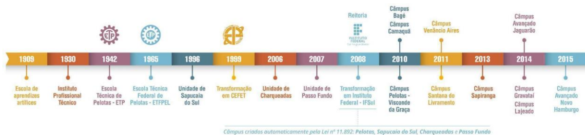
Figura 2 – Linha do tempo de evolução da Instituição

As aulas tiveram início em 1930, quando o município assumiu a Escola de Artes e Ofícios e instituiu a Escola Technico Profissional que, posteriormente, passou a denominar-se Instituto Profissional Técnico e cujos cursos compreendiam grupos de ofícios divididos em seções: Madeira, Metal, Artes Construtivas e Decorativas, Trabalho de Couro e Eletro-Chimica.