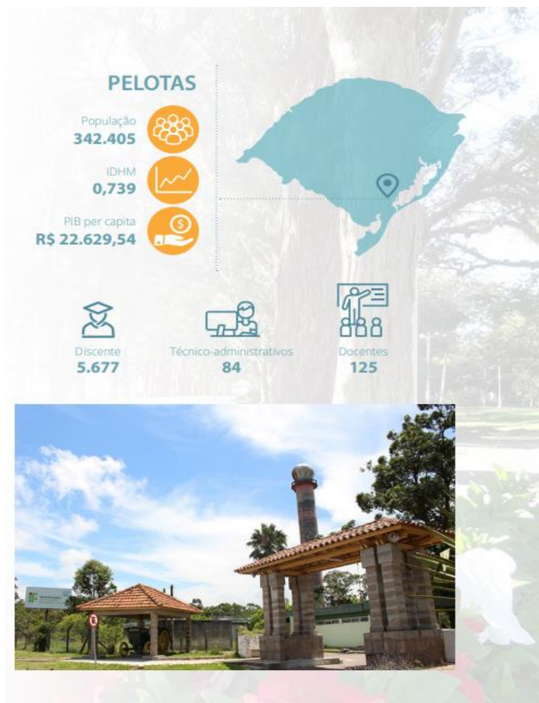
Figura 4 – Câmpus Pelotas Visconde da Graça

O Campus Pelotas - Visconde da Graça tem por objetivo desenvolver o ensino, a pesquisa e a extensão segundo as diretrizes, regulamentações e normas homologadas e estabelecidas pelo Conselho Superior e pela Reitoria IFSul.