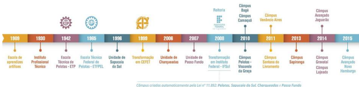
Figura 3 – Linha do tempo de evolução da Instituição