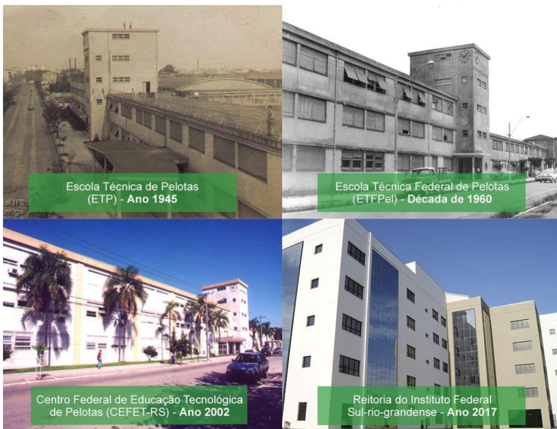
Figura 4 – Prédios da Instituição ao longo do tempo

O Instituto Profissional Técnico funcionou por uma década, sendo extinto em 25 de maio de 1940, e seu prédio demolido para a construção da Escola Técnica de Pelotas. Em 1942, por meio do Decreto-lei nº 4.127, de 25 de fevereiro, subscrito pelo Presidente Getúlio Vargas e pelo Ministro da Educação Gustavo Capanema, foi criada a Escola Técnica de Pelotas (ETP), a primeira e única Instituição do gênero no estado do Rio Grande do Sul. Inaugurada em 11 de outubro de 1943, com a presença do Presidente Getúlio Vargas, começou suas atividades letivas em 1945, com cursos de curta duração (ciclos).