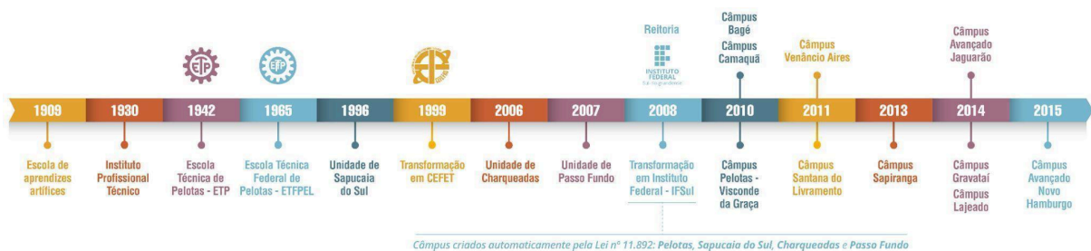
Figura 2 – Linha do tempo de evolução da Instituição

As aulas tiveram início em 1930, quando o município assumiu a Escola de Artes e Ofícios e instituiu a Escola Técnico Profissional que, posteriormente, passou a denominar-se Instituto Profissional Técnico e cujos cursos compreendiam grupos de ofícios divididos em seções: Madeira, Metal, Artes Construtivas e Decorativas, Trabalho de Couro e Eletro-Chimica.