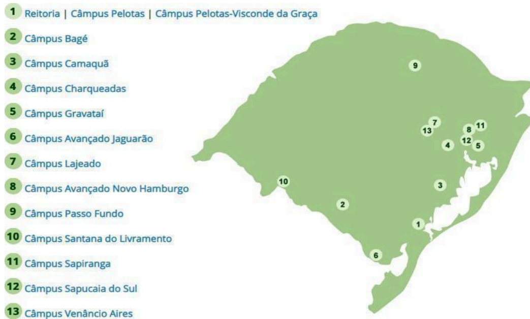
Figura 1 - Distribuição das unidades do IFSul pelo estado

Segundo a Plataforma Nilo Peçanha (PNP), que reúne dados da Rede Federal de Educação Profissional, Científica e Tecnológica (Rede Federal) para fins de cálculos de indicadores, o IFSul atende um total de 24.369 discentes (ano base 2018), matriculados em cursos nas modalidades presencial e a distância. Também exerce o papel de instituição acreditadora e certificadora de competências profissionais.